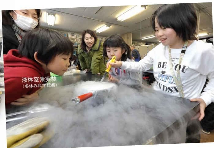
液体窒素実験 (冬休み科学館祭)