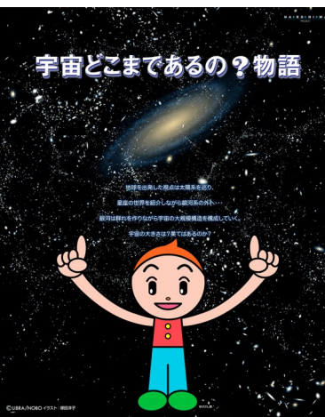
▲番組提供:大同電設(株)