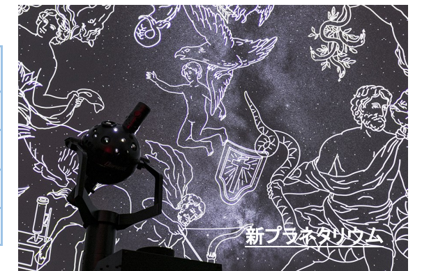
新プラネタリウム