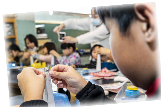
▲万華鏡づくり(ビー玉編)

※実験ショーや工作教室に参加の方は、同じ時間帯のプラネタリウムの観覧はできません。