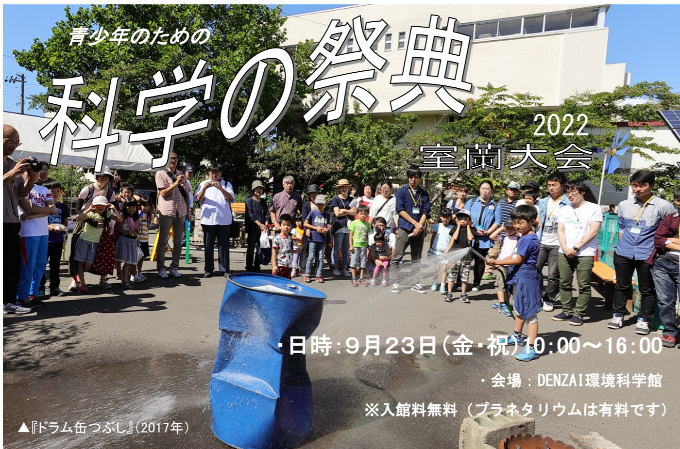
▲『ドラム缶つぶし』(2017年)